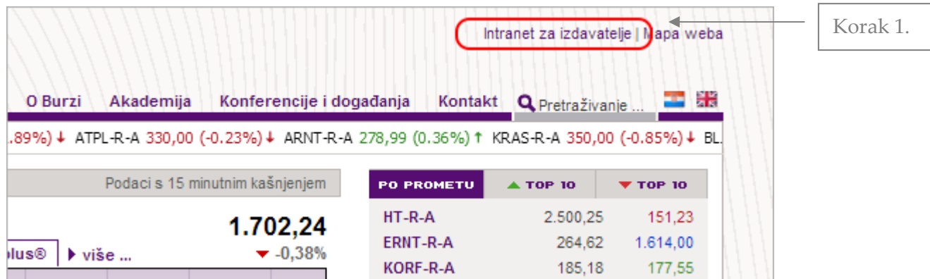
Slika 1. Naslovna stranica

Korak 1. Na naslovnoj internetskoj stranici Zagrebačke burze, u gornjem desnom kutu klikni na Intranet za izdavatelje .