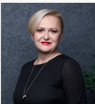
Ivana Gažić, predsjednica Uprave Zagrebačke burze

Zahvaljujemo svima koji su svojim sudjelovanjem u izradi ovoga Kodeksa korporativnog upravljanja doprinijeli definiranju novih ciljeva i prepoznavanju mogućih izazova te na taj način postavili očekivanja za buduća postupanja društava.