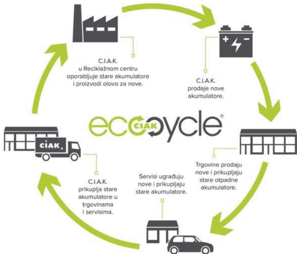
Slika 1 – Prikaz zatvorenog sustava za recikliranje akumulatora i baterija