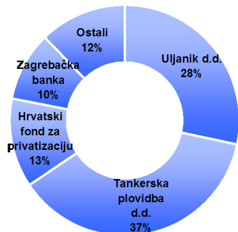
Vlasnička struktura na dan 30.09.2009.

Društvo u bitnome primjenjuje pravila korporativnog upravljanja sukladno Kodeksu kojeg su izradile Hrvatska agencija za nadzor financijskih usluge (HANFA) i Zagrebačka burza. Sve informacije od važnosti za javnost objavljuju se putem Zagrebačke burze i na stranicama Društva.