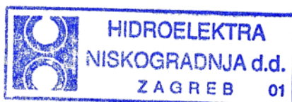
Rade Pilipović, dipl.ing